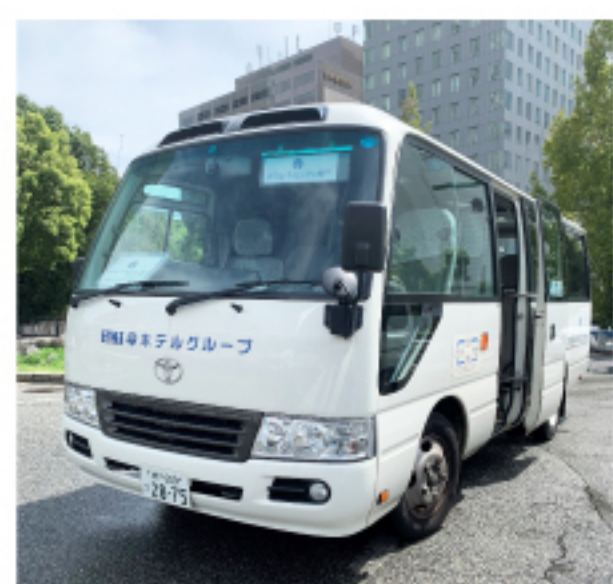
⑤シャトルバスが目印です