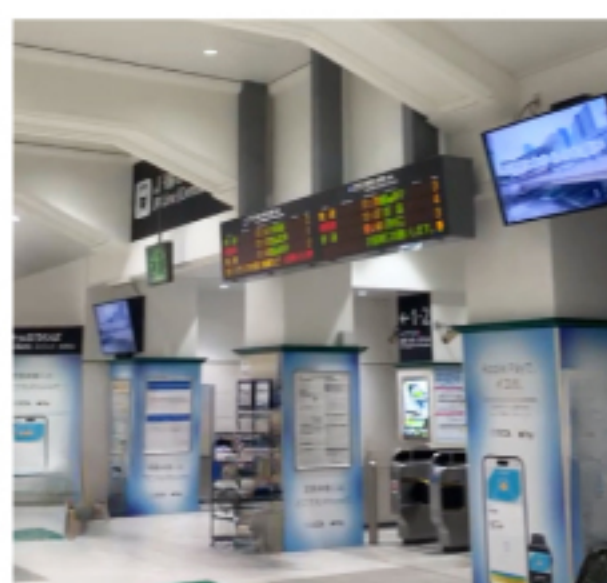
②中央改札を出て左へ