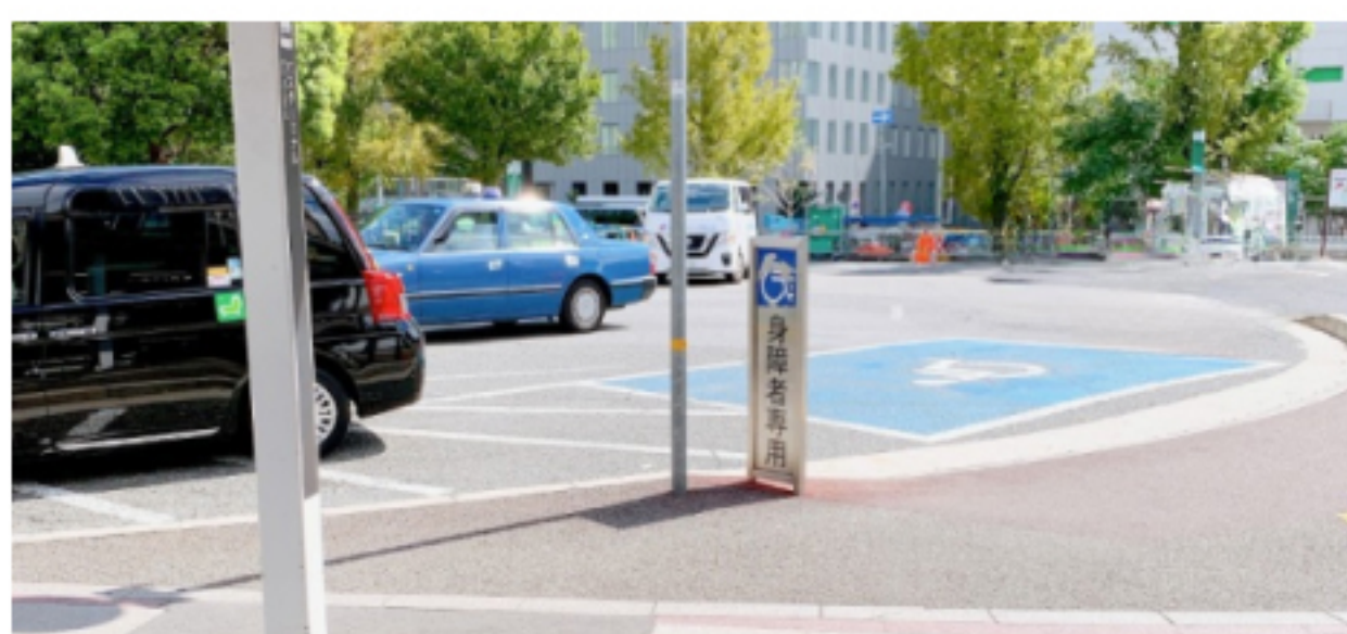
④このあたりでお待ちください